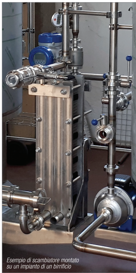
Esempio di scambiatore montato su un impianto di un birrificio

SCAMBIATORI IN ACCIAIO INOX PER UTILIZZO ALIMENTARE